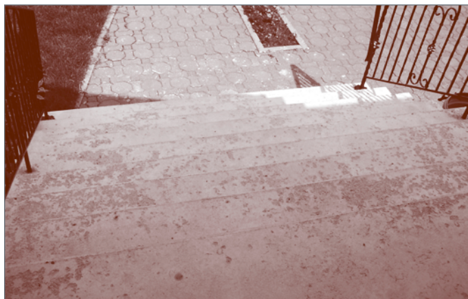
Figure 3c - Écaillage sévère à très sévère d'un escalier de résidence