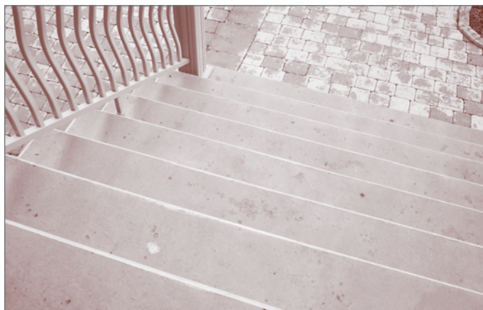
Figure 3b - Écaillage modéré d'un escalier de résidence