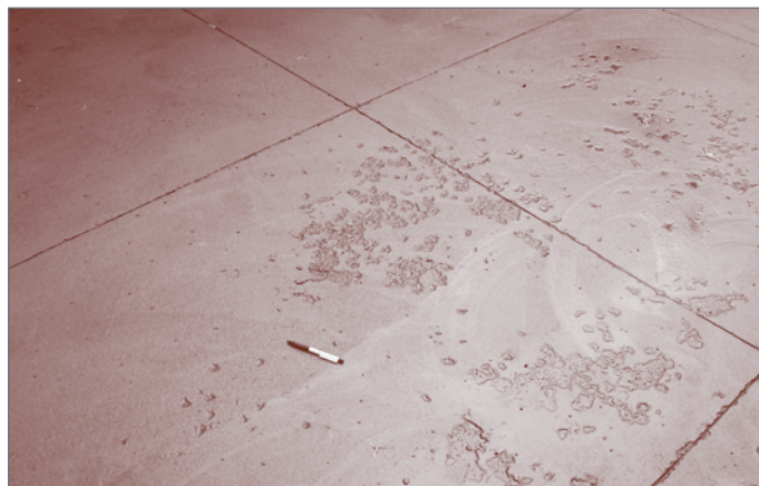
Figure 2c - Écaillage sévère d'une dalle de béton