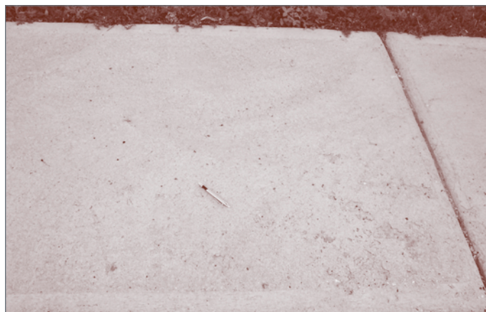
Figure 2b - Écaillage modéré d'une dalle de béton